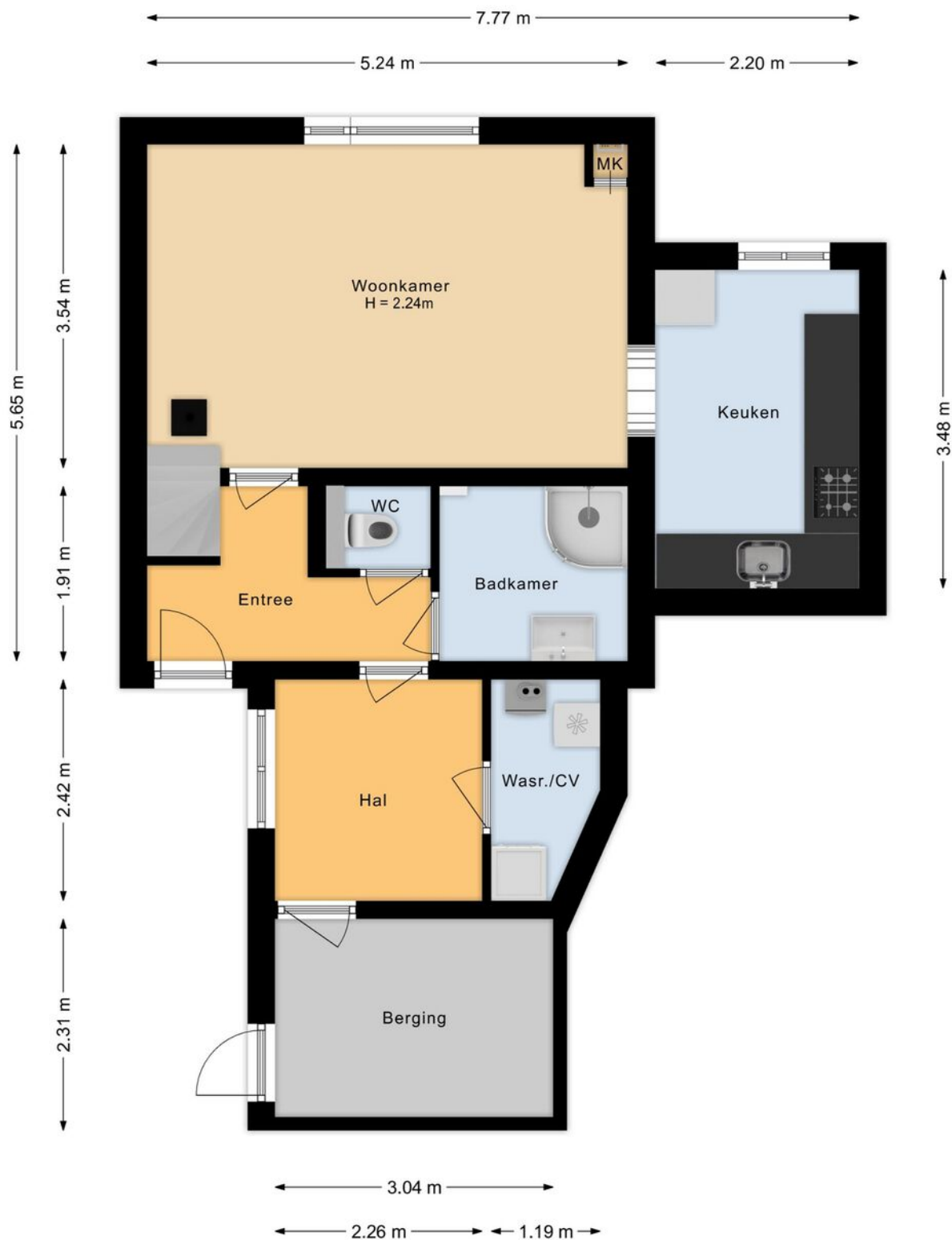
Zuidweg 43, Rijpwetering Begane grond