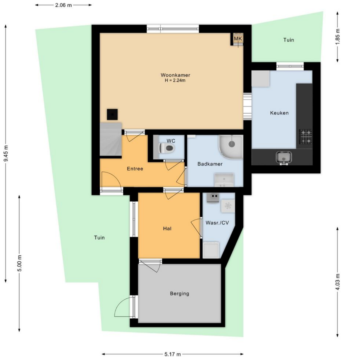
Zuidweg 43, Rijpwetering Situatie